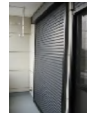
雨戸 シャッター ゆったりとしたバルコニー