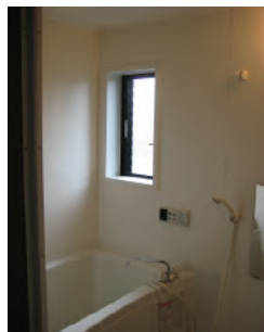
ユニットバス 給湯・追い焚き