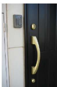
玄関 2重ロック モニターホン