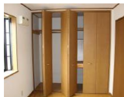
洋室クローゼット