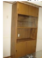
キッチン 備え付け 食器棚