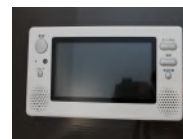
浴室 地デジテレビ付き