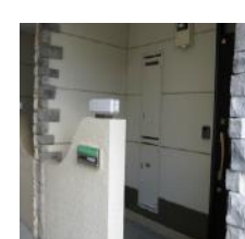
戸建て感覚の独立した玄関 各部屋 玄関・壁の様子が違います