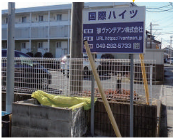
敷地内ごみ置き場