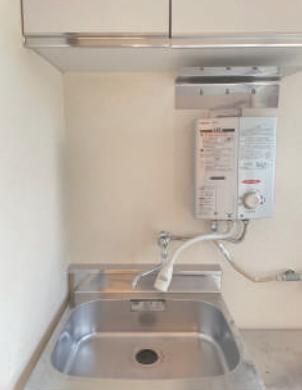
流し台・瞬間湯沸かし器