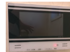
浴室には地デジテレビ付き