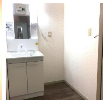
シャンプードレッサー 洗濯機置き場