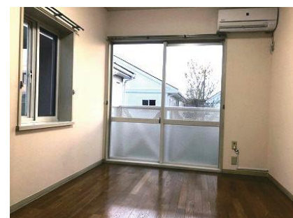
洋室 エアコン付き