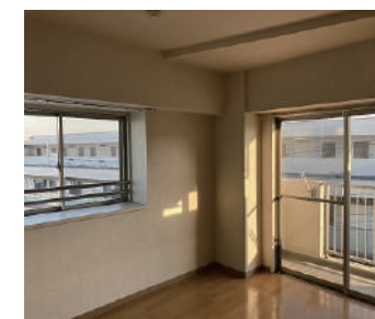
洋室(フローリング)