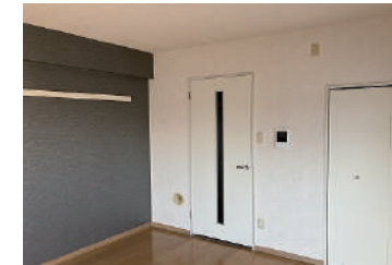
洋室(フローリング)