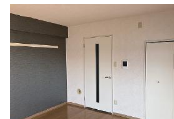
洋室（フローリング）