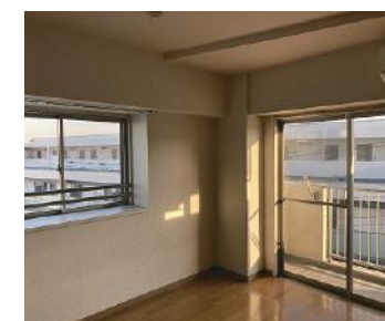
洋室（フローリング）