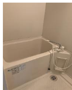
浴室シャワー 追い炊き