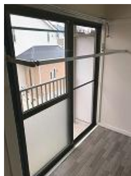
レバーを倒せば物干しに！