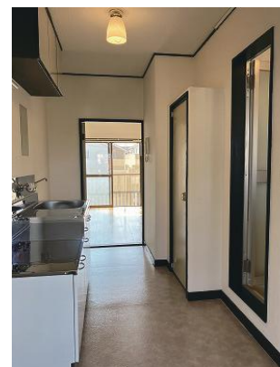
キッチンスペース