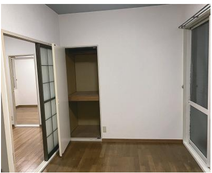
洋室 (7 畳) 物入れ