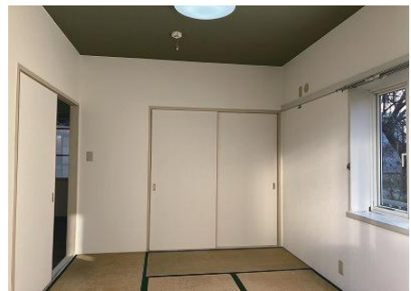
和 室 (6 畳)