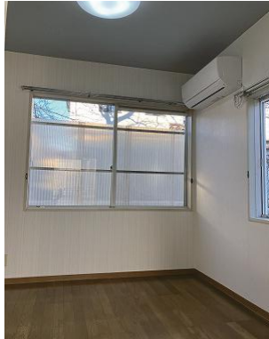
洋室 (4.5 畳)