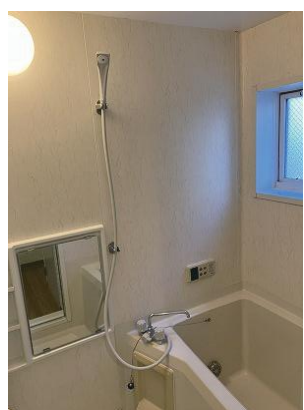
給湯 ユニットバス