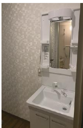
シャンプードレッサー