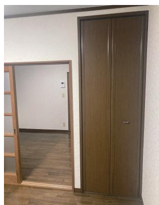
洋室クローゼット

コモディイダ 6分 ドラッグエース 7分 セブンイレブン 8分 川越砂郵便局 4分