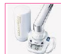
(カートリッジ2年付き)