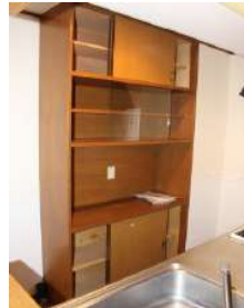
キッチン備え付け カッポード