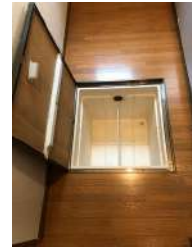
キッチン 床下収納