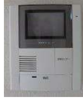
玄関 2重ロック TVモニターホン