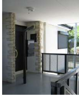
戸建て感覚の独立した玄関