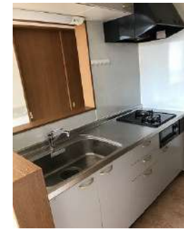
システムキッチン・人感ライト