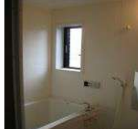
給湯・追炊き・シャワー