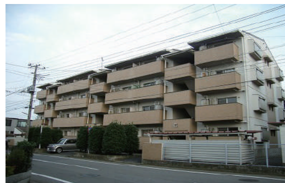
RC4階建て タイル張りマンション