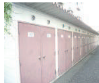
敷地内、収納庫 (部屋ごとにあります)