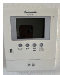
モニター付インターホン