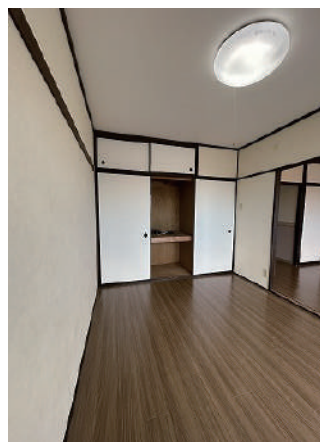
洋間 5.5 帖