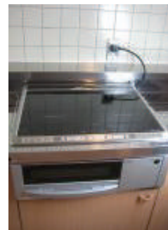
IHクッキングヒーター